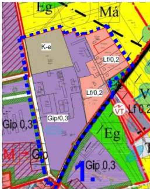
Hatályos terv részlete!